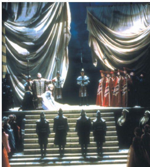
Bocca Negra - Opéra Royal de Wallonie