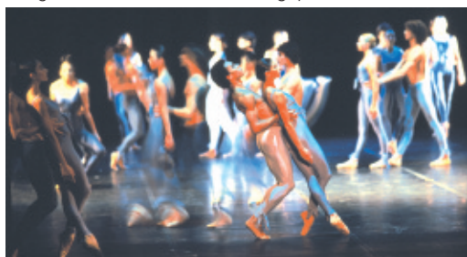
Light - Ballet du XXe siècle