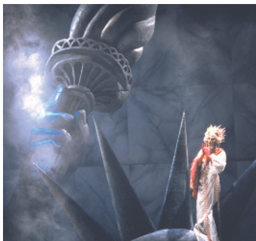
Caligula - Théâtre National de Belgique