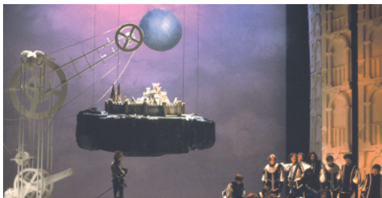
Cyrano de Bergerac - Théâtre National de Belgique